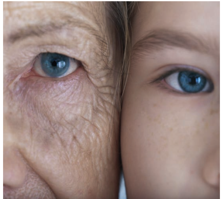
I et inkluderende fellesskap skal den enkelte både se og bli sett.

Kampen for rettferdighet innebærer å stille seg ved siden av medmennesket, ikke som passiv tilskuer, men i aktivt engasjement. Mennesket lever i og er avhengig av samfunnsmessige strukturer. Verdensomspennende systemer er med på å bestemme den enkeltes liv. Det er derfor nødvendig å klargjøre årsakene til menneskelig nød og lidelse, arbeide for å endre forhold som opprettholder nødtilstander og skape nye livsmuligheter. Å vise solidaritet er å ta opp kampen og arbeide for rettferdighet og fred.