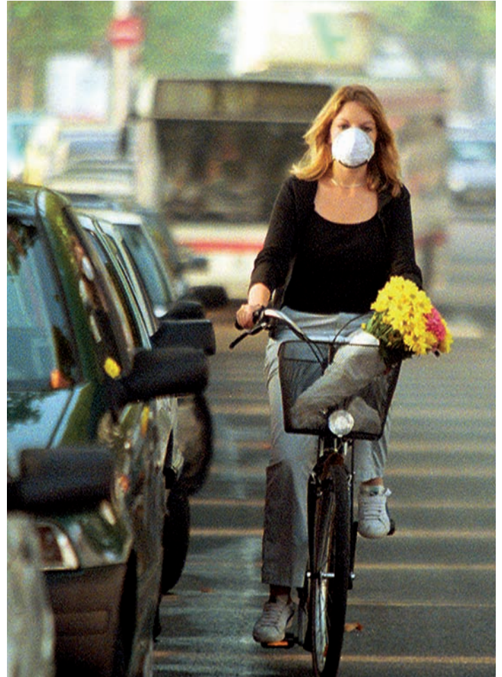
Miljøspørsmålene utfordrer kirkens diakonale virksomhet.

Menneskelivet og menneskeverdet skal vernes fra livet begynner til det ender. Kirken må derfor være en kritisk røst i forhold til dagens abortpraksis, kjempe mot sorteringssamfunnet og aktiv dødshjelp, og engasjere seg i de store etiske problemstillingene som bioteknologien reiser. I tillegg møter diakonien de konkrete utfordringene fra disse områdene på det mellommenneskelige plan. Det finnes organisasjoner som arbeider spesielt med dette. Menigheten lokalt kan jobbe med disse emnene gjennom etisk refleksjon, sjelesorg og praktiske omsorgsoppgaver, for eksempel barnevakts- og støttekontaktordninger.