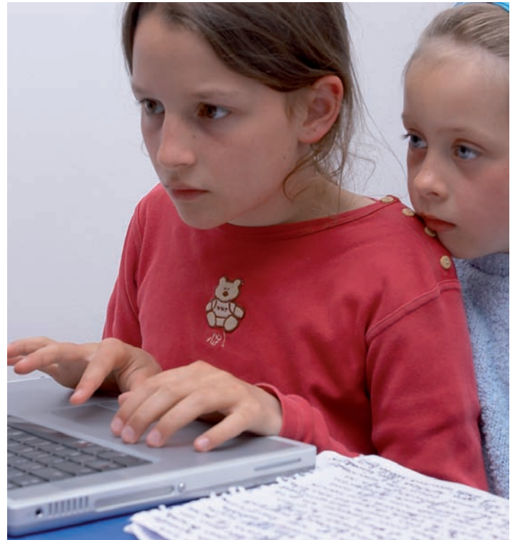
Mobbing av barn og unge skjer også via internett.

Å bekjempe vold betyr også å arbeide med holdninger. Det må drives forebyggende arbeid, blant annet ved aktivt å fremme alkoholfrie soner. Her kan det ligge til rette for lokalt samarbeid med politi, skole, uteseksjon, barnevern og familievern, bymisjon og andre organisasjoner.